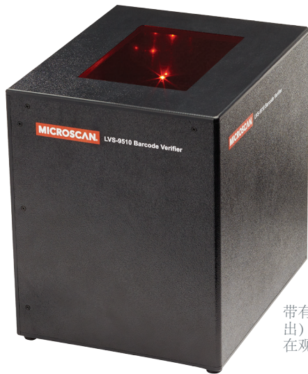
带有手持顶盖（未示出）以使标签位置保持在观察窗内。